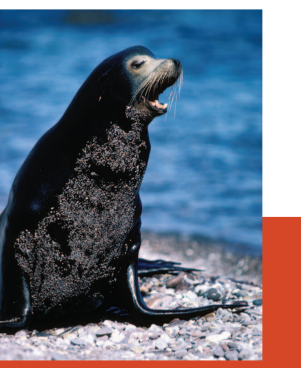
Lobo marino. En México vive más de 60% de la población de Norteamérica de este mamífero.