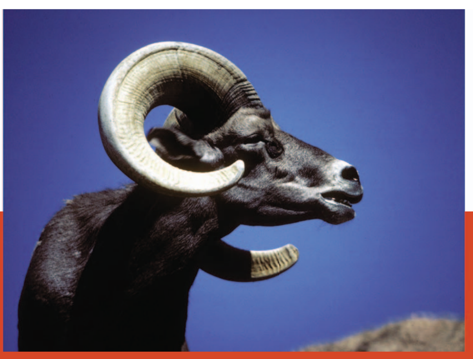
Borrego cimarrón. Habita en lugares inhóspitos y puede soportar climas extremos porque bebe poca agua. En el estado quedan únicamente 2000 individuos.